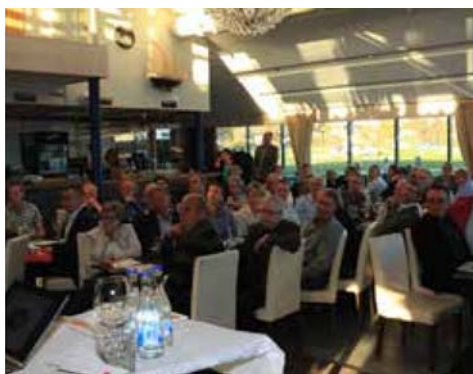
Årsstämma Västerås 24 april 2014

Årsstämma skall hållas senast fyra månader efter räkenskapsårets utgång. På årsstämman tas bl.a. beslut om godkännande av balans- och resultaträkningar, ansvarsfrihet för styrelse och VD samt disposition av företagets balanserade vinstmedel.